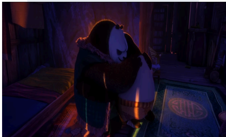
Gambar 3.1. Po berpelukan dengan ayahnya.

Dalam Kung Fu Panda 3 (2016) terdapat satu adegan yang menunjukkan bapak Po yang akhirnya menceritakan masa lalu Po tentang ibunya yang menyelamatkan Po, dimulai dengan suara erhu sebagai pembuka yang dimainkan dengan pelan saat ayah Po ingin Po untuk melihat sesuatu di kamarnya. Ayah Po menceritakan masa lalu ibu Po yang sedih, tetapi Po menerima secara penuh keadaannya, menghasilkan rekonsiliasi yang membuat hubungan ayah anak semakin dekat. Alat musik erhu dan beberapa alat musik gesek lain membantu untuk menyempurnakan rekonsiliasinya.