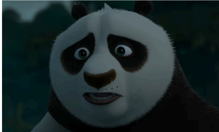
Gambar 3.2. Po mengingat kembali masa lalunya.

Kung Fu Panda 2 (2011) memiliki satu adegan yang menunjukkan Po yang mengingat kembali masa lalunya yang gelap, dimulai dengan Po yang melawan untuk tidak ingin ingat masa lalunya, tetapi dibantah oleh Soothsayer karena itu bukan hanya mimpi buruk, tapi kenyataannya, shot ini diiringi dengan berbagai alat musik gesek untuk menambahkan kesan tegang untuk memperlihatkan perlawanan Po dengan masa lalunya. Alat musik geseknya menjadi lebih ramai ketika Po mulai mengingat seluruh masa lalunya. Setelah mengingat semua masa lalunya, alat musiknya kembali sepi dan pelan. Namun tidak lama kemudian, ditunjukkan juga berbagai flashback perjuangan Po dari bertemu ayah angkatnya hingga menjadi prajurit naga, diiringi musik dengan berbagai alat musik gesek dan alat musik lainnya yang secara progresif menjadi lebih ramai menunjukkan Po sudah menerima masa lalunya dan siap untuk melawan antagonis yang menciptakan masa lalunya.