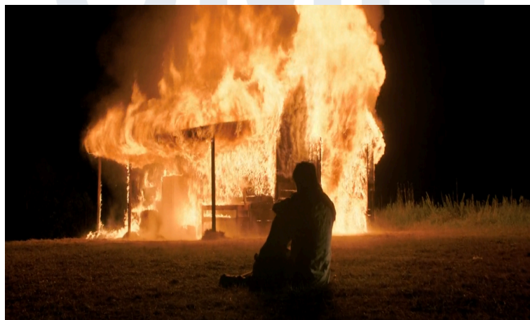
Gambar 3.3. Jacob dan Monica berpelukan melihat musibah yang terjadi.

Kung Fu Panda 2 (2011) memiliki satu adegan yang menunjukkan Po yang mengingat kembali masa lalunya yang gelap, dimulai dengan Po yang melawan untuk tidak ingin ingat masa lalunya, tetapi dibantah oleh Soothsayer karena itu bukan hanya mimpi buruk, tapi kenyataannya, shot ini diiringi dengan berbagai alat musik gesek untuk menambahkan kesan tegang untuk memperlihatkan perlawanan Po dengan masa lalunya. Alat musik geseknya menjadi lebih ramai ketika Po mulai mengingat seluruh masa lalunya. Setelah mengingat semua masa lalunya, alat musiknya kembali sepi dan pelan. Namun tidak lama kemudian, ditunjukkan juga berbagai flashback perjuangan Po dari bertemu ayah angkatnya hingga menjadi prajurit naga, diiringi musik dengan berbagai alat musik gesek dan alat musik lainnya yang secara progresif menjadi lebih ramai menunjukkan Po sudah menerima masa lalunya dan siap untuk melawan antagonis yang menciptakan masa lalunya.